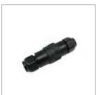
Connecteur rapide IP2 pôles LKITA00000000017