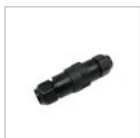
Connecteur rapide IP3 pôles LKITA00000000003