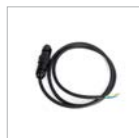
Câble avec connecteur Ca. 2m/Co. IP 2 poli LKITA00000000040 Ca. 2m/Co. IP 3 poli LKITA00000000041