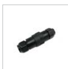
Connecteur rapide IP2 pôles LKITA00000000017