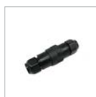
Connecteur rapide IP3 pôles LKITA00000000003