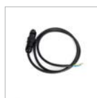
Câble avec connecteur Ca. 2m/Co. IP 2 poli LKITA00000000040 Ca. 2m/Co. IP 3 poli LKITA00000000041