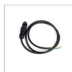
Câble avec connecteur Ca. 2m/Co. IP 2 poli LKITA00000000040 Ca. 2m/Co. IP 3 poli LKITA00000000041