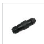
Connecteur rapide IP2 pôles LKITA00000000017