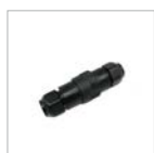
Connecteur rapide IP3 pôles LKITA00000000003