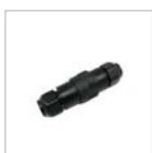
Connecteur rapide IP3 pôles LKITA00000000003