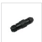
Connecteur rapide IP2 pôles LKITA00000000017