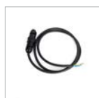
Câble avec connecteur Ca. 2m/Co. IP 2 poli LKITA00000000040 Ca. 2m/Co. IP 3 poli LKITA00000000041