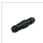
Connecteur rapide IP 3 pôles LKITA00000000003