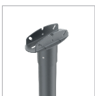
Pôle connexion B Max 2 x Qm LKITA00000040109