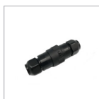
Connecteur rapide IP 3 pôles LKITA00000000003