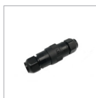
Connecteur rapide IP 3 pôles LKITA00000000003