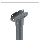
Pôle connexion B Max 2 x Qm LKITA00000040109