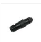
Connecteur rapide IP2 pôles LKITA00000000017