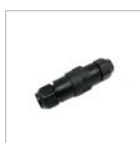
Connecteur rapide IP 3 pôles LKITA00000000003