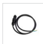
Câble avec connecteur LKITA00000000040 LKITA00000000041