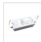
Kit d'urgence LKITA00000000095