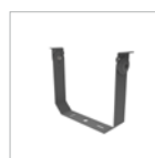
Kit de mur/ plafond LKITA00000000016