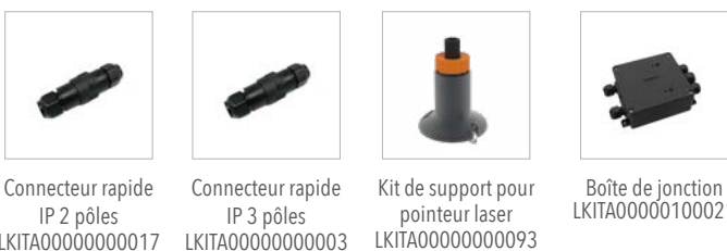
Connecteur rapide IP 2 pôles LKITA00000000017