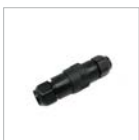
Connecteur rapide IP 2 pôles LKITA00000000017