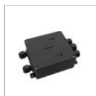
Boîte de jonction LKITA00000100021