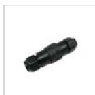
Connecteur rapide IP 3 pôles LKITA00000000003