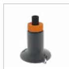
Kit de support pour pointeur laser LKITA00000000093