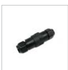
Connecteur rapide IP 2 pôles LKITA00000000017