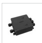
Boîte de jonction LKITA00000100021