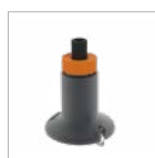
Kit de support pour pointeur laser LKITA00000000093