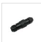
Connecteur rapide IP 3 pôles LKITA00000000003