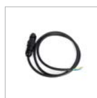
Cavo con connettore Ca. 2m/Co. IP 2 poli LKITA00000000040 Ca. 2m/Co. IP 3 poli LKITA00000000041