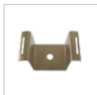
Kit attacco a plafone LKITA00000000031