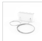
Kit alimentazione LKITA00000000034