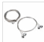
Kit sospensione LKITA00000000033