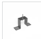
Kit incasso no frame LKITA00000000032