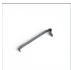
Kit attacco a parete LKITA00000000030