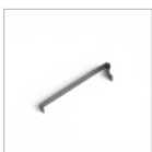
Kit attacco a parete LKITA00000000030