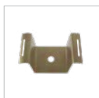
Kit attacco a plafone LKITA00000000031