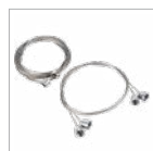
Kit sospensione LKITA00000000033