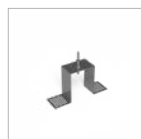
Kit incasso no frame LKITA00000000032