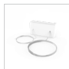
Kit alimentazione LKITA00000000034