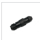
Connettore rapido IP 3 poli LKITA0000000003