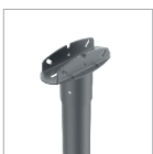
Raccordo testa palo B LKITA00000040109