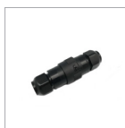
Connettore rapido IP 3 poli LKITA00000000003