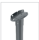
Raccordo testa palo B LKITA00000040109