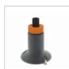
Kit supporto puntatore laser LKITA00000000093