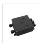
Kit scatola di derivazione LKITA00000100021