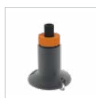
Kit supporto puntatore laser LKITA00000000093