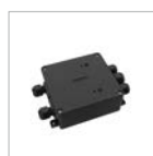
Kit scatola di derivazione LKITA00000100021