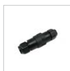
Connettore rapido IP 3 poli LKITA00000000003