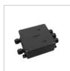
Kit scatola di derivazione LKITA00000100021