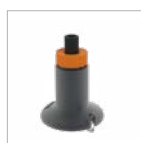
Kit supporto puntatore laser LKITA00000000093